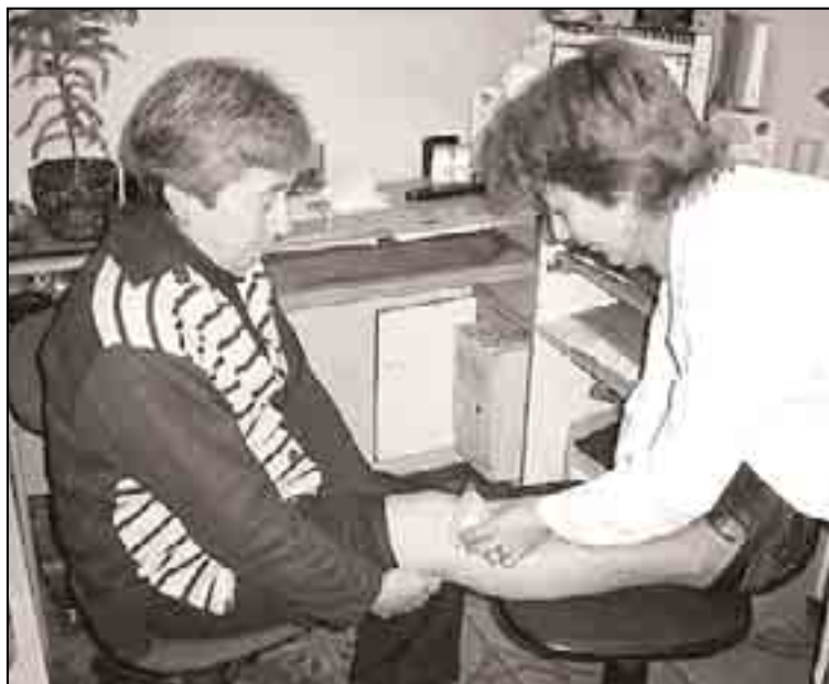
En una sesión se pueden aplicar muchos agujijones, dependiendo de la tolerancia del paciente.