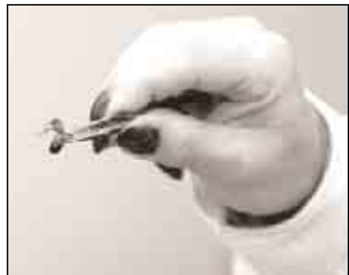
De norte a sur del país sólo hay 34 apiterapeutas.